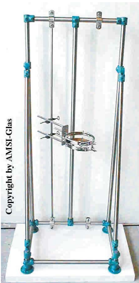
Gestell für komplette Apparatur 500 ml bis ca. 3000 ml