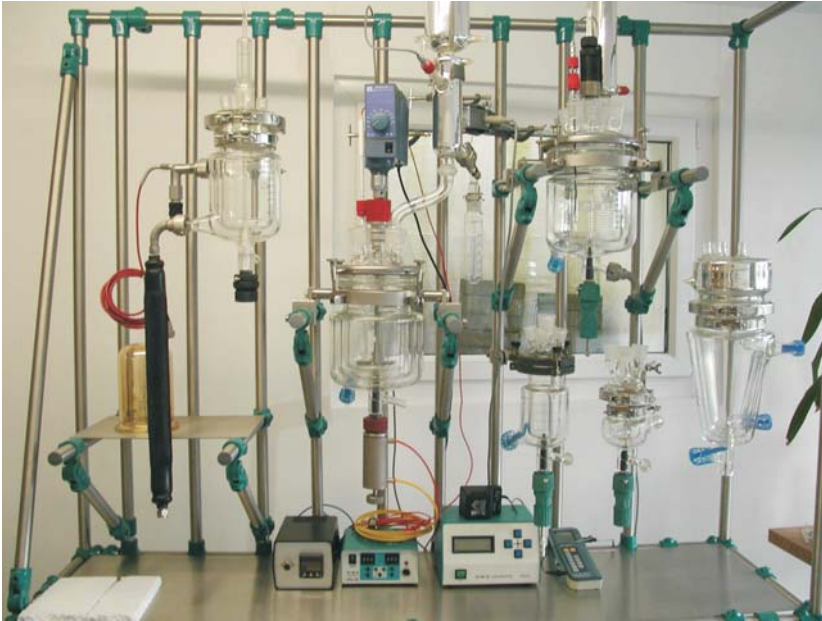
Gestell für div. Apparaturen - kundenspezifische Ausführung